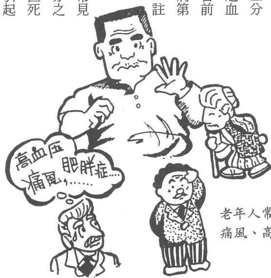
老年人常見的疾病： 痛風、高血壓等

(一) 糖尿病 ：在新陳代謝及內分泌疾病中最常見的是糖尿病。在台灣四十歲以上的人約有百分之五有糖尿病，民國七十二年糖尿病佔台灣地區死亡原因之第八。糖尿病控制得不好，可能會引起