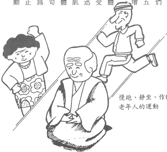
一四 慢跑、靜坐、作體操是適合老年人的運動

人的神經系統組織是最繁密，也是爲了身體活動需要才如此發達的。神經系統主要的是接受一些內在或外在感覺性的刺激立即反應，然後迅速發生命令，指揮肌肉產生動作。因此老人的肌肉要不斷的運動、操作，才能協調腦神經，身體肌肉神經同時運動，才能防止老化、退化。換句話說，人類的身體是爲了活動而生存，並不是爲了休息而生活。因此人類要正常的攝取食物，正常的勞動工作，即使是老年人，也需要四肢運動