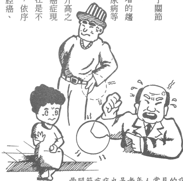
骨關節疾病也是老年人常見的病痛

惡性腫瘤，特別是癌症，是隨著年齡升高之傾向，雖然癌症之罹患率尚不清楚，但從癌症現佔死亡率之第一位看起來，癌症病人實在是不少。男性中老年人因癌症死亡的種類順位，依序為肝癌、胃癌、肺癌、食道癌、腸癌、口腔癌、膀胱癌及鼻咽癌。(鍾宏昌一一二) 女性中老年人常見癌症的種類順位，依次序是子宮癌、肝