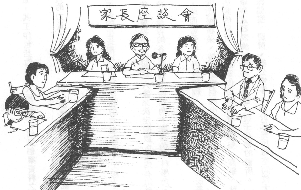
托兒所推展親職教育的方式之一——舉辦家長座談會

規模較大的托兒所均有專任護士的設置，為幼兒調配營養餐點、督導環境衛生、指導幼兒個人衛生、健康檢查、患病幼兒的護理，以及意外傷害的處理等。