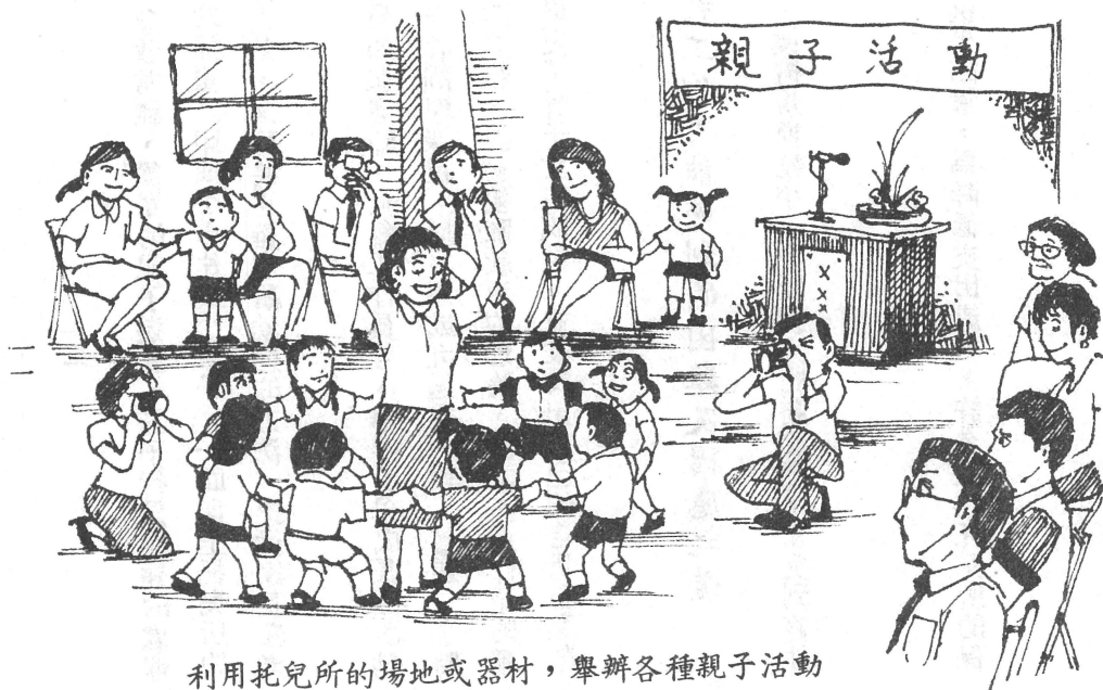
利用托兒所的場地或器材，舉辦各種親子活動