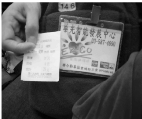
圖六 無障礙旅遊護照

即使是天候不佳 我們還是風雨無阻 勇往直前風貓趣 僅僅片刻的偶然相遇 只是想要將心中的溫暖 帶給流浪的街貓 抱牠撫牠 我們知道生命無價 所以要在天主的愛中扶持弱小者 ..... 風雨無阻我們出發了