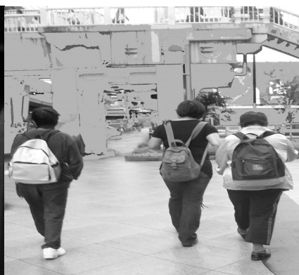
圖七 EZ-GO 旅遊一景