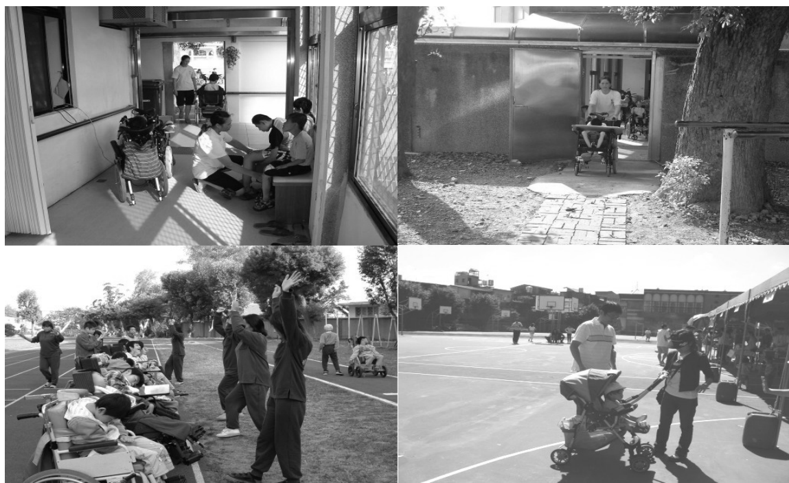
圖 1~4 方便之門。

致力服務當中，時時可見創意和巧思，世光的「方便之門」即爲一例，世光與竹東高中緊鄰，兩個單位因爲關懷與創意，圍牆解構了：「有了這道門，…志工推著坐輪椅的院童來到學校大樹下、草坪上，或乘涼或做體能或相關活動等，讓人看了很感動。」(陳權欣，2007)。世光爲服務對象賺到陽光和空間，竹東高中也爲他們的學生賺到時刻都在的生命教育機會，「方便之門」也是「互惠之門」(請見圖 1~4)。