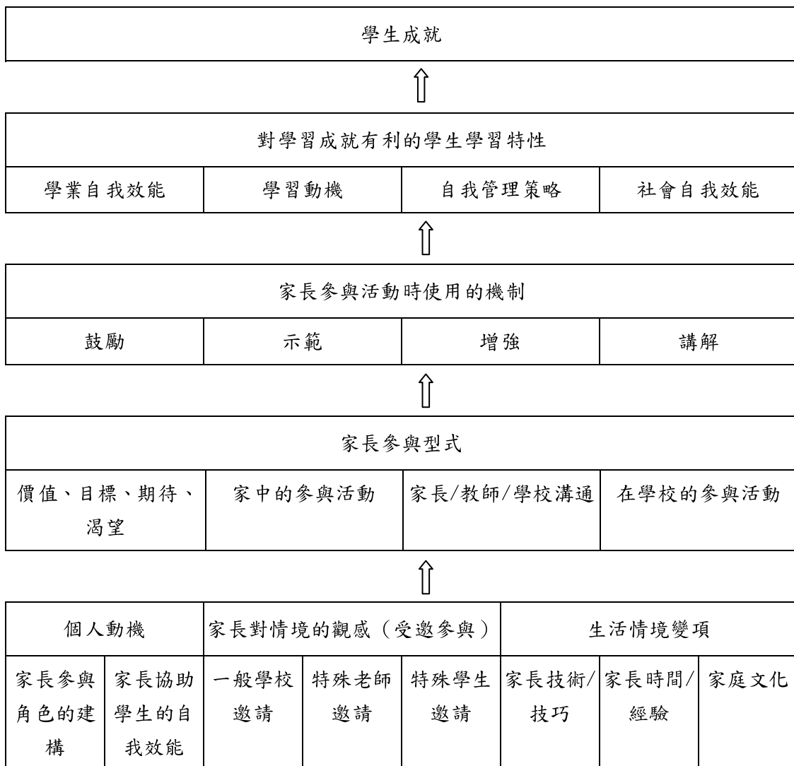
圖 2：家長參與過程模型（引自 Hoover-Dmpsey, Whitaker & Ice, 2009）

從孩童本身（如年齡大小）、老師和學校三者身上感受參與的必要性。生活情境變項上則包括家長本身是否具有參與的知識與技巧、家長是否有時間精力來參與、和家庭文化等三因素來影響家長對孩童學習的參與與否。