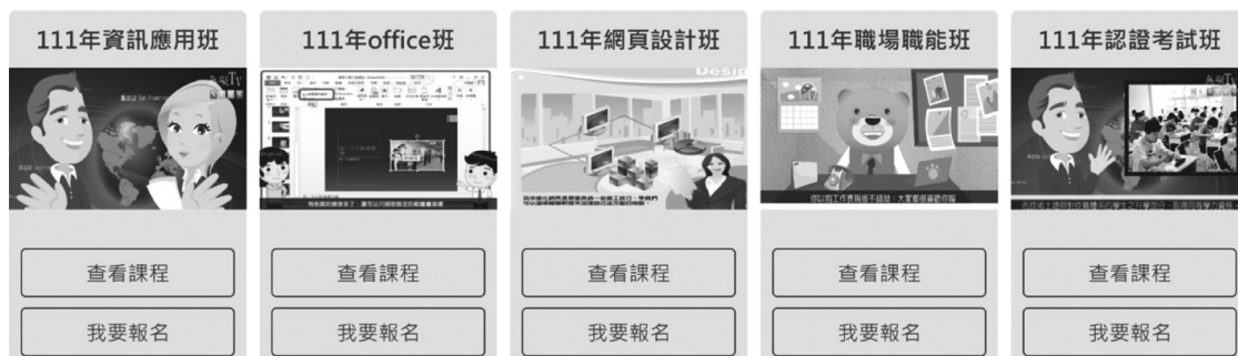
圖 2 無礙e網開授的五個班級課程