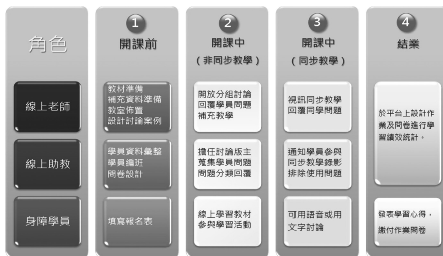
圖3 無礙e網學習服務設計：開課流程