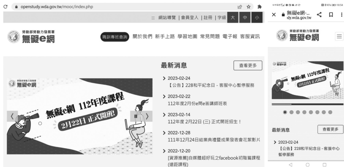
圖1 無礙e網首頁的響應式網頁設計（可同時滿足電腦版和手機版不同需求）

因為「無礙e網」服務的學員包括視覺障礙、聽覺障礙、肢體障礙和認知障礙等四大障別。身心障礙學員的障別差異會造成各項學習的困難，其中認知障礙學習者對於教材理解能力較差，因此無障礙數位學習教材的內容設計宜分為「非認知障礙」（無障礙數位教材）及「認知障礙」（無障礙易讀版數位教材）兩種版本。圖2顯示「無礙e網」開授的五個班級課程。這些課程的設計理念如下。