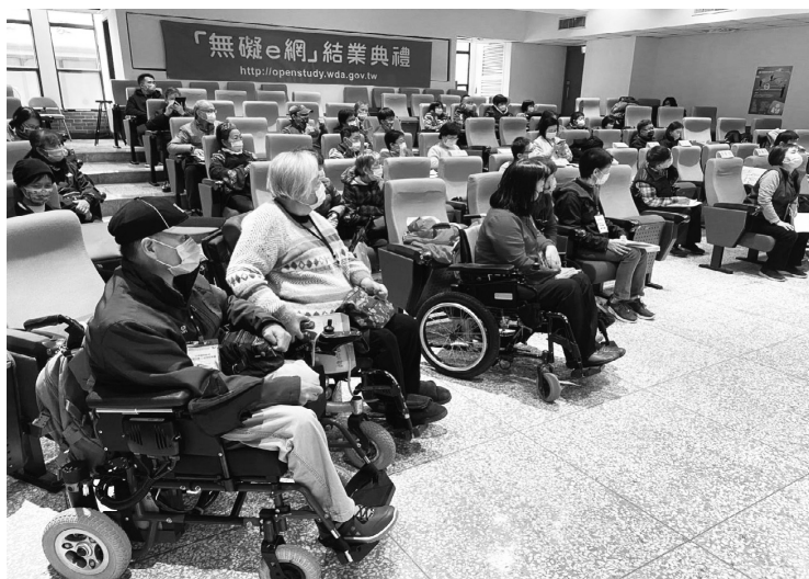
圖 5 無礙e網年度結業典禮

過去「無礙e網」的結業典禮都是採用實體、線上混成舉行的模式。在2021年因疫情嚴重，規劃採用兩個遠距視訊軟體雙軌進行舉辦別開生面的全線上結業典禮，提供一個具有參考價值的全線上結業典禮模式。在2022年底因為已經接近後疫情的時間點，決定舉辦實體場域的結業典禮。由於學員分布在全臺灣各地區，有許多身心障礙學員無法親自到場，因此雖然有七成的結業典禮參與者可以親自到場，我們還是必須提供其他三成參與者利用遠距上線的方式來參加結業典禮（圖5）。