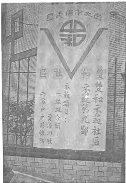
精神標語有助提升居民對社區環保的認同

臺灣地區環境污染的嚴重程度日甚一日，環保運動風起雲湧，政府、民間團體以及愛心人士等，莫不大聲疾呼，希望盡速推動環保工作，但是要如何真正落實環保工作，筆者以為必須從最基層的鄰里單位做起，謹略述如下，藉供參考。