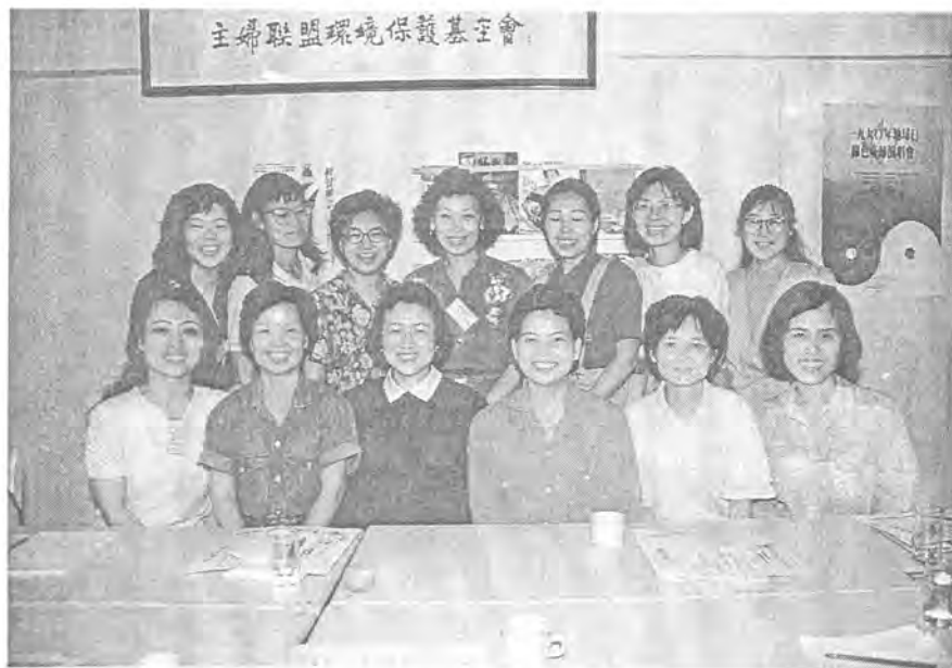
環保媽媽營結業合照

一九八六年底，當外國婦女爲了本身的利益、國家民族的健康、消費者不可剝奪的權益而組織各種有效的團體時，臺灣有一羣主婦却十分慚愧於從來沒有主動參與的經驗和努力。面對臺灣環境問題的嚴重破壞，再也不能坐視不顧，這一羣主婦開始積極投入環境保護工作。