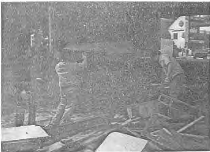
大型垃圾須特別處理

清晨六點，來自四面八方的清潔隊員在班長的點名分配工作之後，隨即展開忙碌的一天，婦女或年長者分配清掃馬路，收大型垃圾、傢俱物品等則需年輕力壯者。大約到了八點後，清潔員將所撿拾