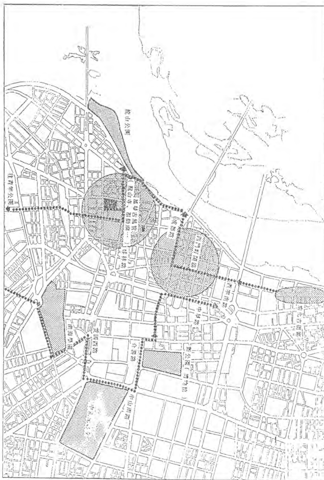
圖一、觀光遊覽路線建議圖