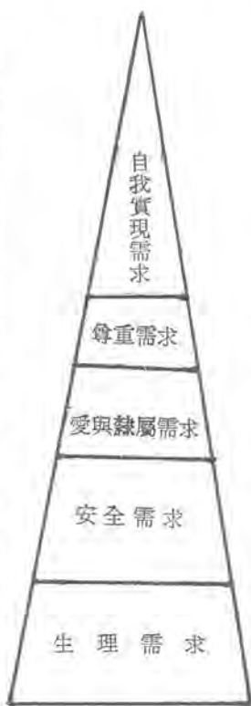
馬斯洛人類需求層次

上列(一)(二)(三)的需求，都帶有「利己」的意味，只有(四)才是「利他」的，所以，做一個現代化的人必須做社會服務，「施」比「受」更有福，人生以服務為本，這樣才能活得快樂。