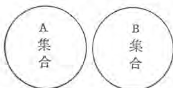
圖二：似是而非的觀念——