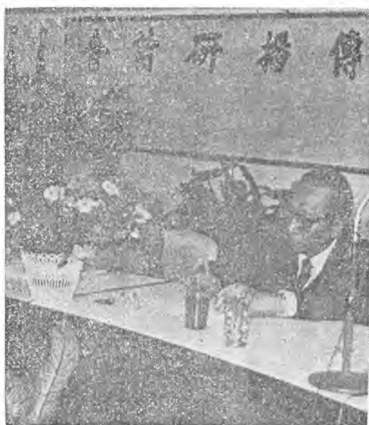
與孫騰長行執詹心中本 議會持主同共興建任主李

開會時間：七十二年十一月卅日 地點：師大綜合大樓五〇二室 主辦單位：中華民國社區發展研究訓練中心 國立師範大學社會教育學系