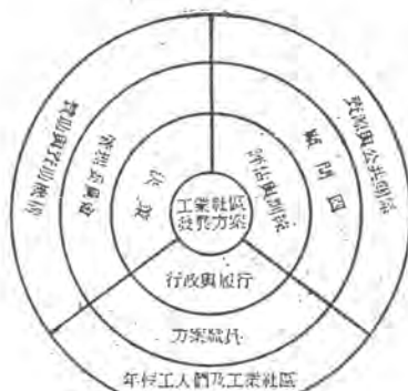
圖一、工業社區發展行動模式