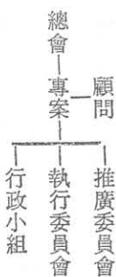
表一：專案組織架構表

推廣委員會係邀請社會各界領袖五十一位共同組成，其中三十多位來自工商企業界，近二十位來自各專業團體（律師、建築師、會計師、醫師等），民意代表，傳播媒體，及人民團體負責人等。