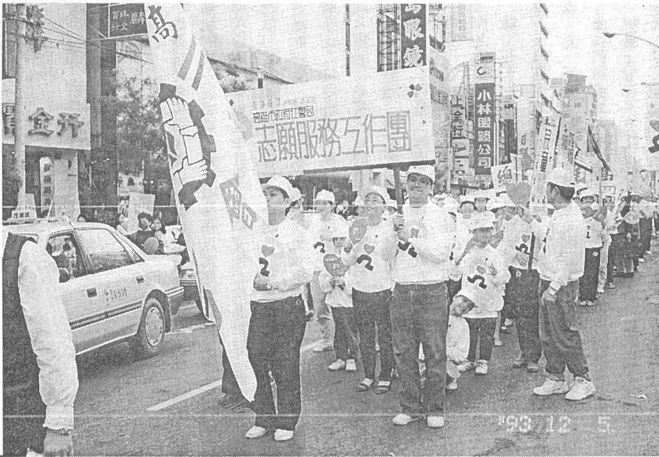
志工在旗幟飛揚的街頭遊行82.12.5