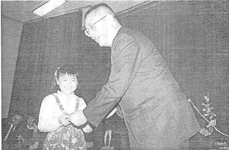
高雄育幼院院童接受吳市長慰問金