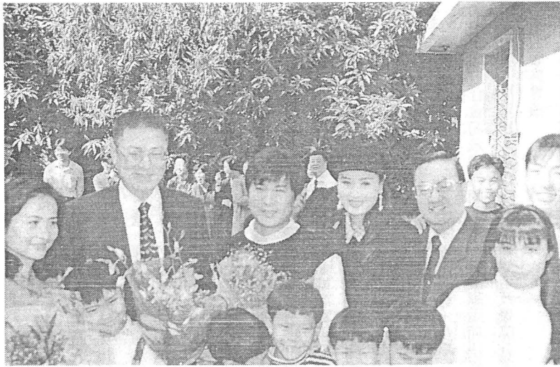
吳敦義市長暨夫人及蘇文靈局長與胡瓜等演藝人員及高雄育幼院童合攝