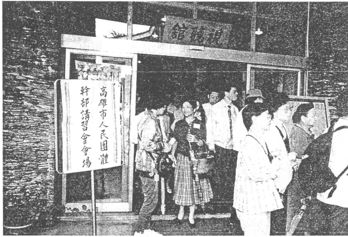
◎全體人員於視聽館參加講習

已增加到一千八百多個團體，承辦人還是四位，而且還增加了一個消費合作社的業務。雖然業務增加了一倍以上，但我們為民服務的熱忱絕對不會減少。有關會務補助的問題，則因預算編列困難，且因僧多粥少，各單位申請難如所願，尚祈各單位見諒。」