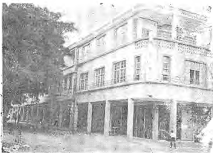
金城鎮新開完成的「商業社區」外觀。

二、地方受益方面：(一)先期所繁殖淡水魚，每年可收益新臺幣約四〇〇、〇〇〇元。(二)湖中所儲淡水，可用以灌溉東岸一帶農田。(三)能防止金沙港潮水侵蝕，使兩岸土地變為良田。(四)能防止太武山發源的金沙溪於天雨時洪水泛濫，使原來因淹沒而不能種植的田地，都可以栽種穀物。(五)增加種植土地面積約五〇〇市畝。(六)改善農民耕作環境，增加