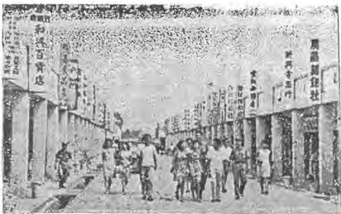
。象景榮繁的「區社市新」鎮湖金的成完建開

供暇時之戲，都要籌劃辦理，把中國變成一個安樂國家，才算是民生主義的完成」。圖強必以社會組織為重點，以糾合羣力，激發愛國情緒，發揮民族精神，繼承祖先光榮歷史，才能建設一個現代化的國家。這兩大目標，正是我們推行社區發展的正確理想，就一般情況而言，凡屬國家建設與發展之事項，特別屬於國防交通者，以行政力量自上而下舉辦為合理，凡屬社區建設與發展之事項，特別屬於民生福利者，以社區發展方式自發自動興辦為有效。