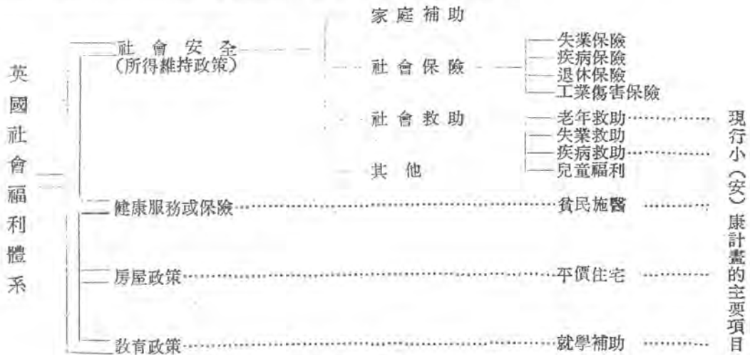
圖二：英國社會福利體系圖與小(安)康計畫關係圖

一般而言，歐美國家民主國家的社會福利系統涵蓋教育、國民住宅、健康醫療保險與社會安全制度；社會救助則隸屬於社會安全制度下重要的一環。以英國的社會福利體系為例，其責任的分工與職權的劃分，極為精細，整個社會福利系統如圖二所示（註七）。由此可見，社會福利發展的方向愈趨向專門化與分工化。所以在籌劃我國社會福利體系的過程中，小(安)康計畫的一些責任與服務項目，必須劃歸獨立或併入其他單位，使小(安)康計畫的目的與涵義真正的符合社會救助的意義。