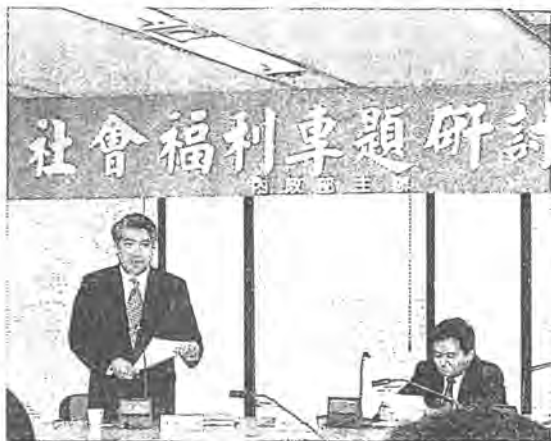
◎詹教授火生專題演講