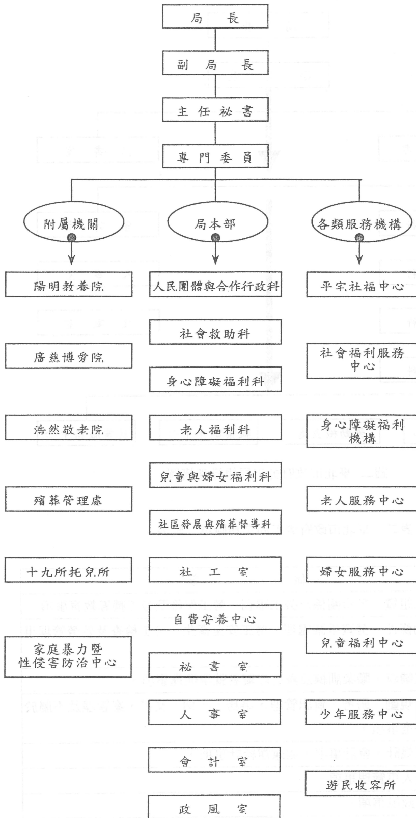
圖一 臺北市政府社會局組織架構圖

屬於社政單位的，後來在社會需求與選舉考量下，逐步成立勞工與原住民政行政組織，社政、勞工與原住民政行政組織之分工，並非完全基於功能的劃分。臺北市政府之社會局、勞工局與原住民政事務委員會是否有業務及資源重疊的問題？以下分別從此三行政機關之組織架構與業務職掌，來探討其業務重疊與資源競合等問題。