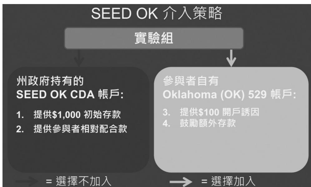
圖 2 Seed OK 實驗組設計

助，因為這樣的政策工具是由財政部門來負責管理，並協調納入衛生福利、教育等部門，據此可知，這個實驗的推動是一個多功能：包括市場部門和政府部門的相關協調、並結合社會發展中心來發展兒童發展帳戶的體制框架。因此，兒童發展帳戶需要一個蒐集研究數據的平台，試想如福利部門只能聚焦提供社會服務的內涵、卻無法思考如何透過資產累積來影響家戶接受政府的指引，其方案效果將不盡理想；然而如有一個平台能蒐集不同的數據，包括方案參與問卷的數據、銀行、兒童發展帳戶體系的資料、出生時、相關福利使用的數據資料，形成了一個資料庫，適時提供相關數據和政府部門服務的連結，如政府的稅收需從金融部門獲得，並與社會福