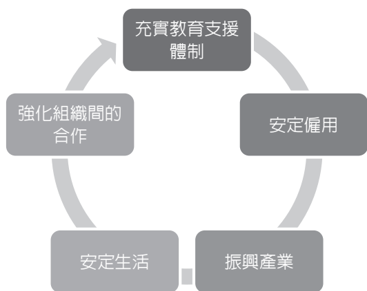
圖 1 提升愛奴人生活相關推動方案