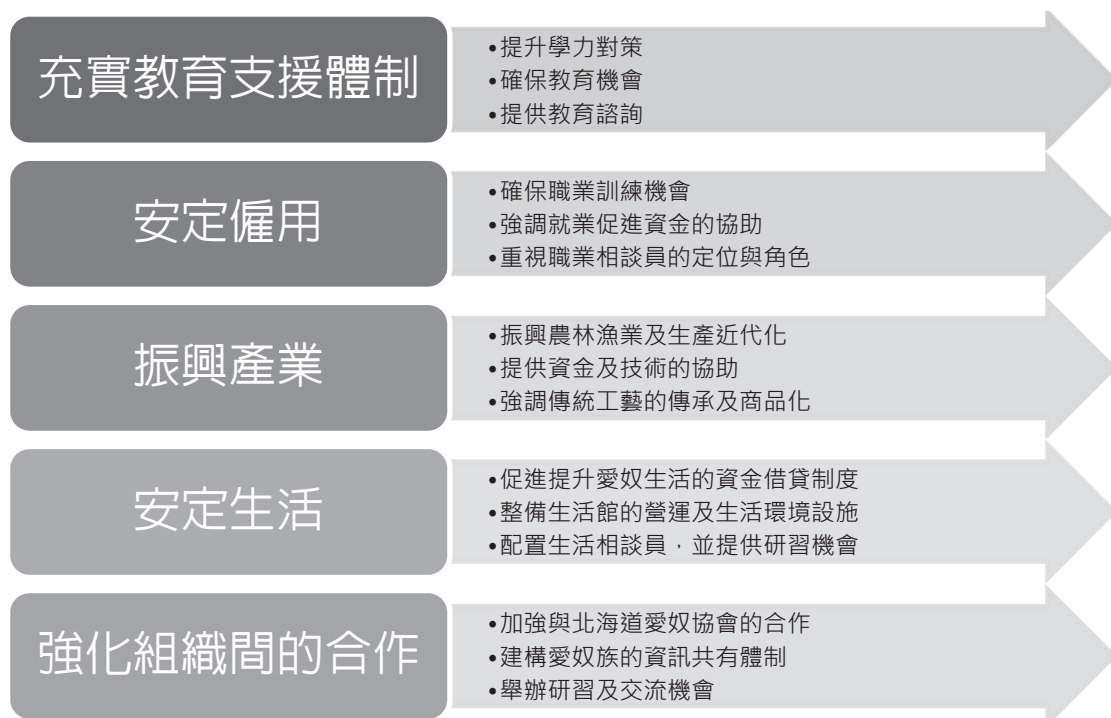
圖 2 提升愛奴人生活相關推動具體方案