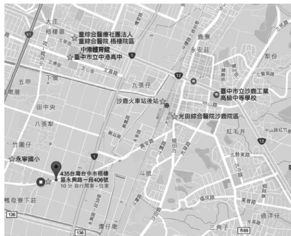
圖 2 目標家戶周邊環境設施

目標家戶居住在臺中市梧棲區，與臺中港比鄰，距離貫穿臺中市的臺灣大道約 4.2 公里，開車約莫 10 分鐘，步行需要 37 分鐘。若欲搭乘公車到達臺中市政府，炯太太須先步行 37 分鐘後，轉乘公車，車程約 1 小時零 7 分鐘。若從住家到當地區公所約 4.7 公里，步行時間 59 分鐘，開車 12 分鐘。從交通距離來看，算是臺中市邊陲區域，公車系統不普及，多數居民會選擇摩托車或自己開車。