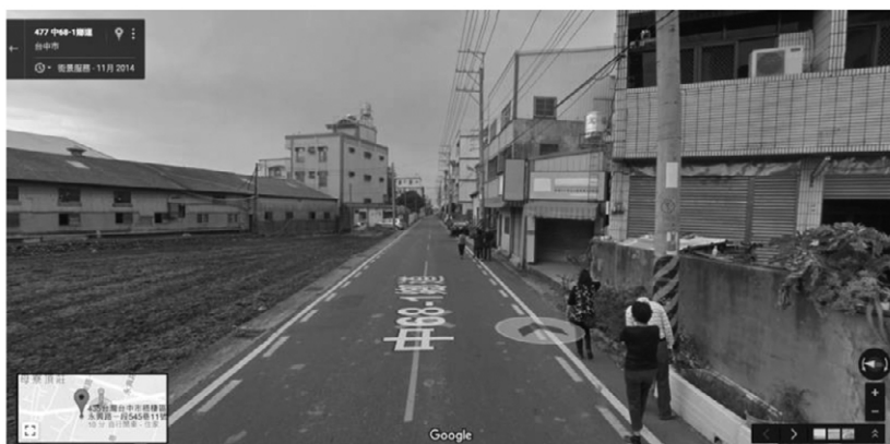
圖 3 目標家戶周邊環境

目標家戶宅第共三層樓，外加地下室，計 4 層樓。每層樓格局都相同，樓梯在全戶中間分隔前後，樓梯兩側各有一個約前面 9 坪，後半 7 坪的空間。二樓以上每層樓有兩個房間，共用樓梯旁的浴室。