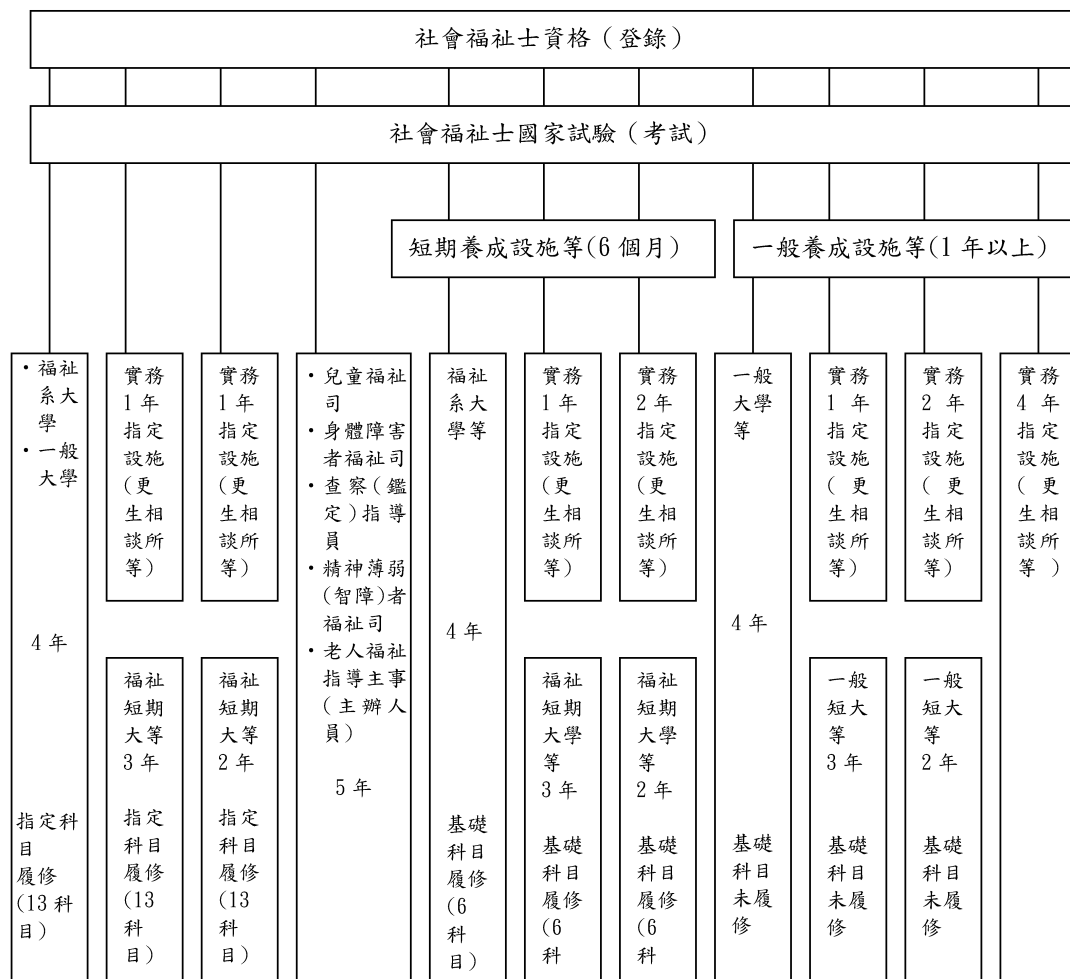
圖 1 社會福祉士（社會工作師）資格取得方法圖