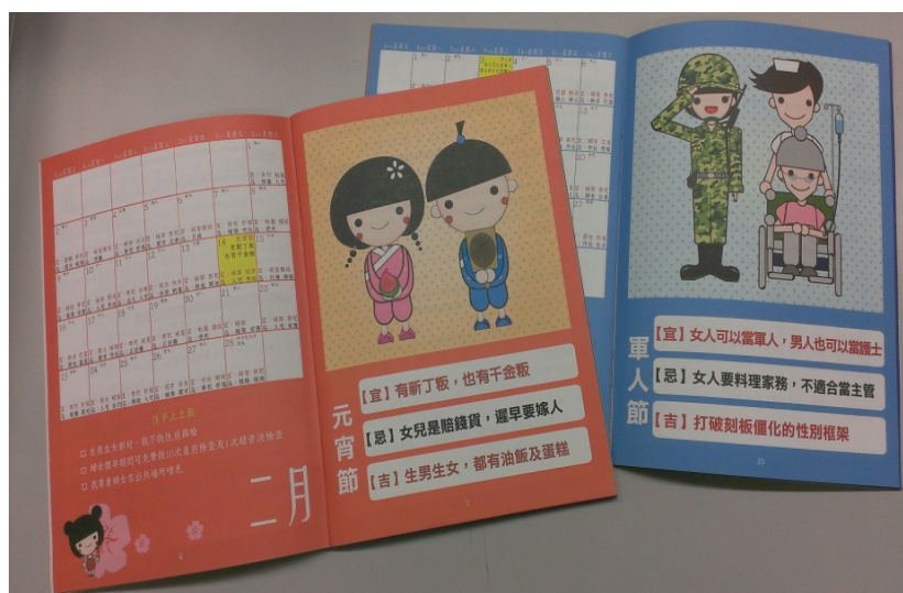
圖 2 性平農民曆

性平農民曆之設計，配合當月應景節日，用可愛易懂的圖片呈現具有新時代性平意義的文化習俗，如大年初一可以回娘家、清明節姐姐妹妹回家掃墓去等，鼓勵市民跳脫傳統束縛女性禮俗文化觀念，讓市民隨著性平農民曆的引導，天天都是性別平等的「好日子」，見圖 2。