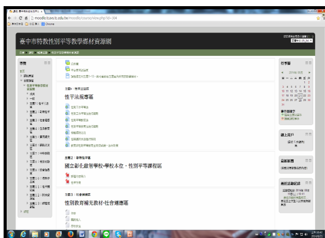
圖 1 臺中市特教性別平等教學媒材資源網

2011 年的行動研究筆者希望將自己所編製、拍攝的智障生性侵害防治教學媒材，放在本校 moodle 數位平臺上以達推廣的目標；而就在 2014 年承接臺中市特教性別平等行動研究專案，於是將研究建議實現，建構完成身障學生性別平等教學媒材資源平臺（如下圖 1）【平臺名稱：臺中市特教性別平等教學媒材資源網（網址： http://moodle.tcavs.tc.edu.tw/moodle/course/view.php?id=304 ）】，以下簡稱性平資源平臺】，以供有需要的國中教師到本性平資源平臺下載、應用所需性平教學資源。